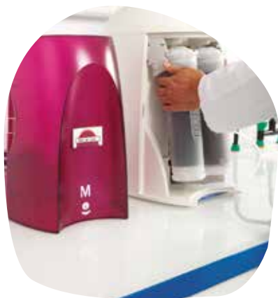
Схема работы системы RiOs-DI®